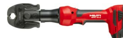
č. artiklu. 2227014