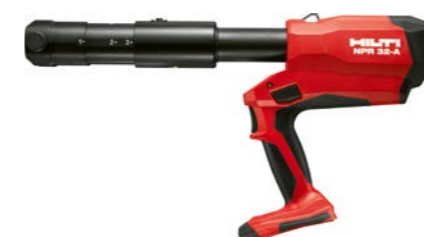
č. artiklu: 2195302